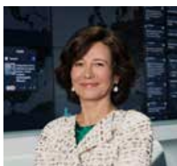
Ana Botín, Presidenta de Banco Santander

“ Nuestro éxito en 2017 demuestra que nuestra forma de hacer negocios y nuestro foco en el cliente basado en la confianza están creando un círculo virtuoso que genera crecimiento, rentabilidad y fortaleza ”