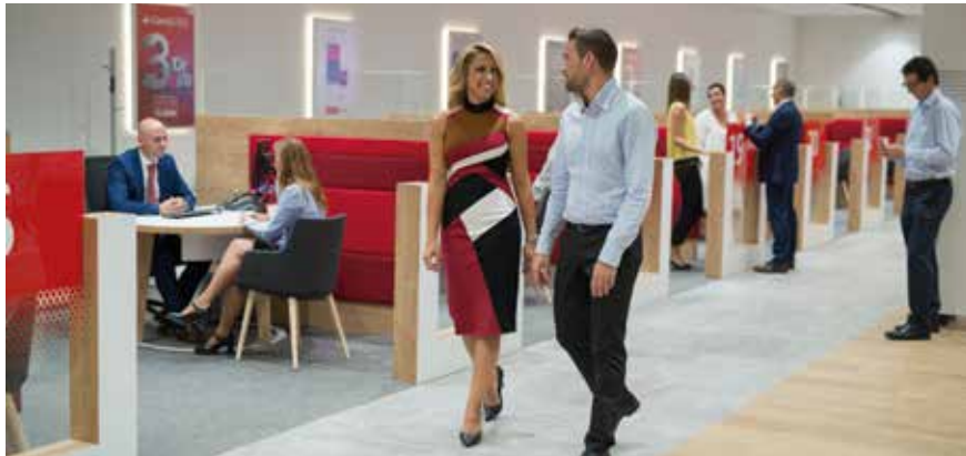
Oficina de Santander en España

Para cumplir nuestra misión de contribuir al progreso de las personas y las empresas, estamos realizando una transformación que comienza en nuestros empleados. Tenemos el objetivo de ser uno de los mejores bancos para trabajar, capaz de atraer y retener el mejor talento global.